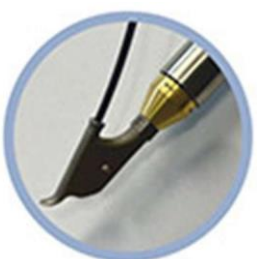
cambio veloce dell'ugello