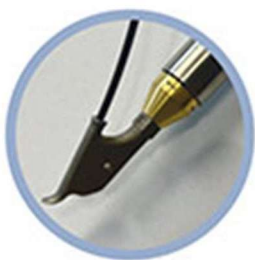
cambio veloce dell'ugello